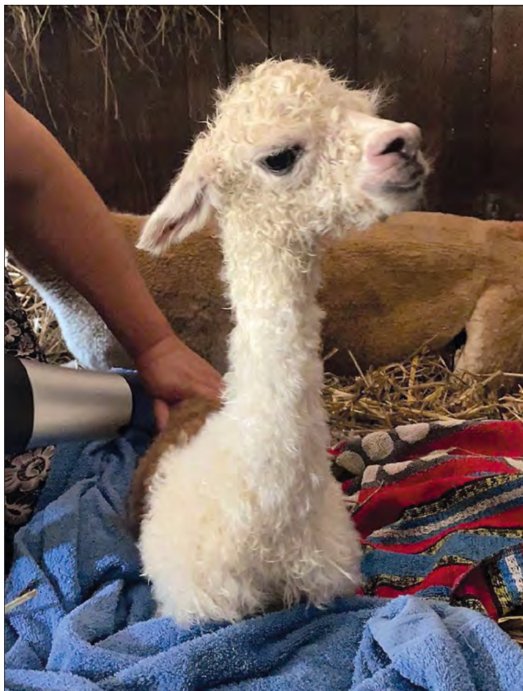
Ryc. 2. Osuszanie noworodka zaraz po urodzeniu

organizmu (ryc. 2). Jeżeli cria urodziło się w nocy lub gdy jest niska temperatura powietrza, potrzebne jest dodatkowe okrycie noworodka. W 2021 r. pojawiła się publikacja peruwiańskich naukowców, Valenzuela i wsp. (14) dotycząca wpływu ochrony cria przed ich wyziębieniem na ich przeżycie do 12. tygodnia i przyrosty masy ciała (14). Zastosowanie kamizelki na ciało cria zaraz po urodzeniu poprawiło o 100% żywotność w ciągu pierwszych 12 tygodni oraz miało wpływ na przyrost masy ciała (0,17 kg dziennie) w porównaniu z półotwartą szopą (76% przeżycie; 0,14 kg dziennie) i z otwartą zagrodą (64% przeżywalności; 0,13 kg dziennie; 14). Whitehead (15) już w 2009 r. rekomendowała używanie kamizelek ochronnych bez względu na strefę klimatyczną. Przed wychłodzeniem należy chronić każde cria, które rodzi się słabe lub w niesprzyjających warunkach pogodowych (15).