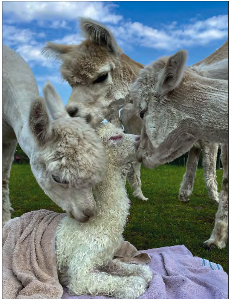
Ryc. 3. Samica nawiązuje więź z młodym poprzez obwąchiwanie, nawoływanie i dotykanie nosem do nosa (Hodowla Alpak Coniraya)

Przyczyny poronień u alpaka mogą być zakaźne lub niezakaźne. Wśród czynników zakaźnych wymienia się wirusy – u alpaka potwierdzono ronienia związane z zakażeniem wirusem wirusowej biegunki bydła i wirusem zakaźnego zapalenia tętnic koni. Podejrzewa się również możliwość zakażenia herpeswirusem koni – EHV 1 i 4, na zakażenie którym alpaki również